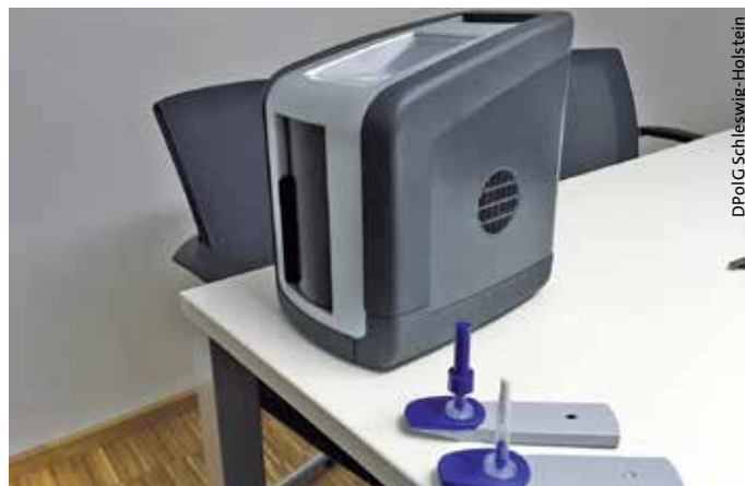
> Drogentest 5000 der Firma Dräger

Es ist bereits in mehreren Bundesländern im Einsatz.