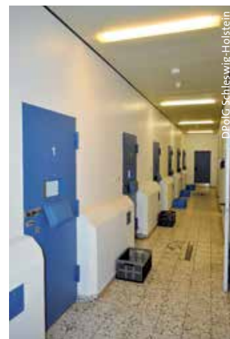
> Der Gewahrsamstrakt beim Polizeirevier Itzehoe

dernisieren. Nach damaligem Stand könne definitiv mit einer Modernisierung des gesamten Gewahrsamsbereiches im Sommer 2015 begonnen werden.