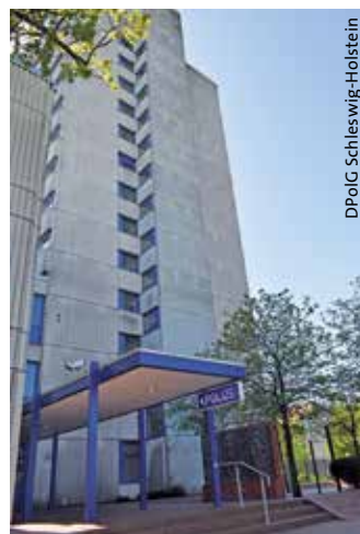
> Das Behördenhochhaus der PD Itzehoe

Als erster Schritt wurde im Herbst 2014 zugesagt, den Bereich des Gewahrsams innerhalb der Wache endlich zu mo-